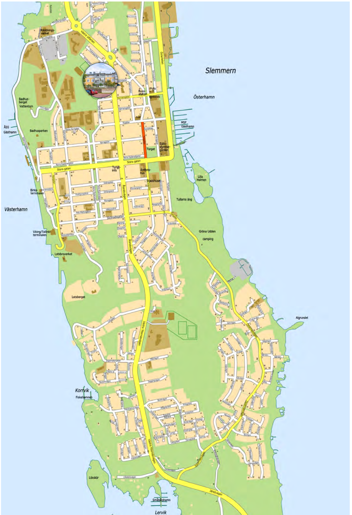
Turistkarta från www.mariehamn.ax